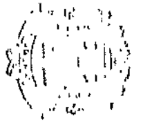
TABELA DE SALÁRIOS DO QUADRO DE PESSOAL REGIDO PELA C.L.T

PREFEITURA MUNICIPAL DE SÃO PAULO ESTADO DE SÃO PAULO