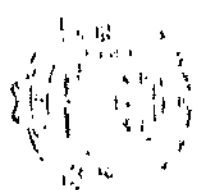
TABELA DE VENCIMENTOS DE PESSOAL DE PROVIMENTO EFETIVO

TRIBUNAL REGIONAL DO TRABALHO DA 1ª REGIÃO ESTADO DO PARANÁ